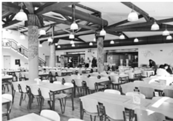
2. Kde se nachází tento sál? – 2010