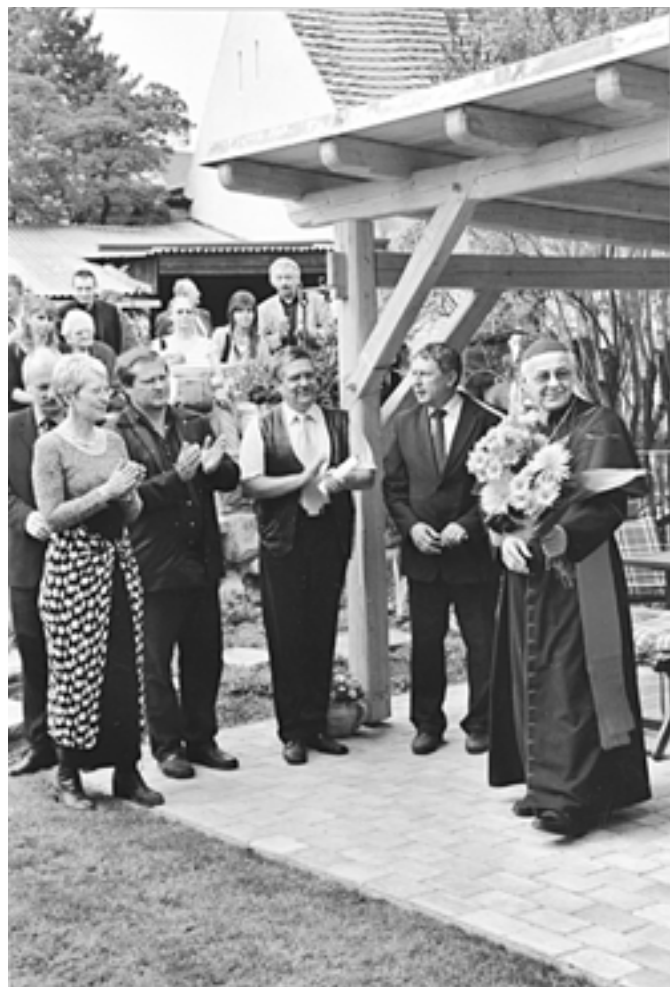
4. Poznáte někoho z lidí v popředí? – 2009