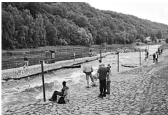
3. Kde na „Staré řece“ se nachází tato stavba? – 2009