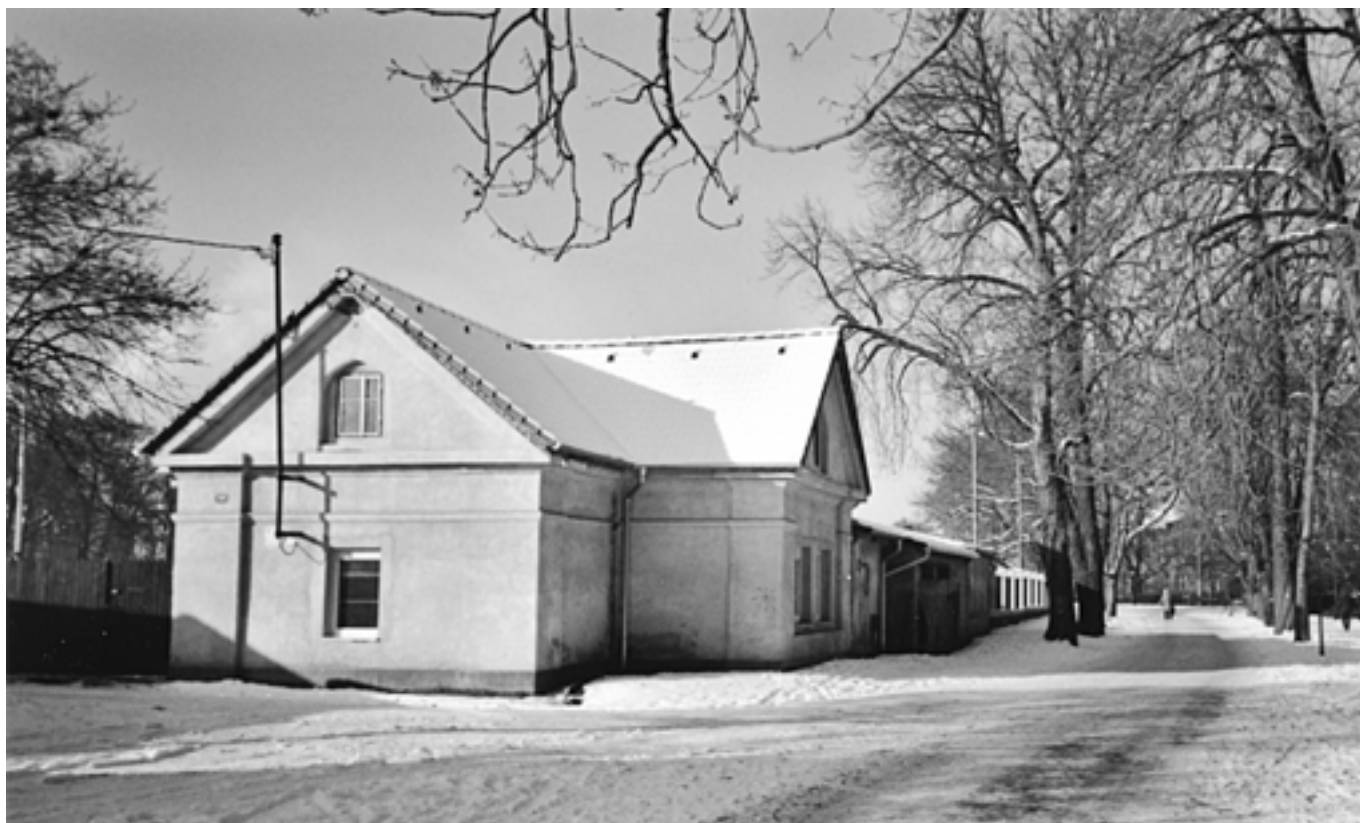
1. Kde stojí tento domek? – 2008