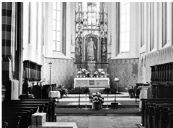
Kostel sv. Bartoloměje, hlavní novogotický oltář - 2009