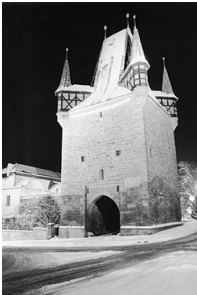
Pražská brána z r. 1516 od J. Kameníka - 2009