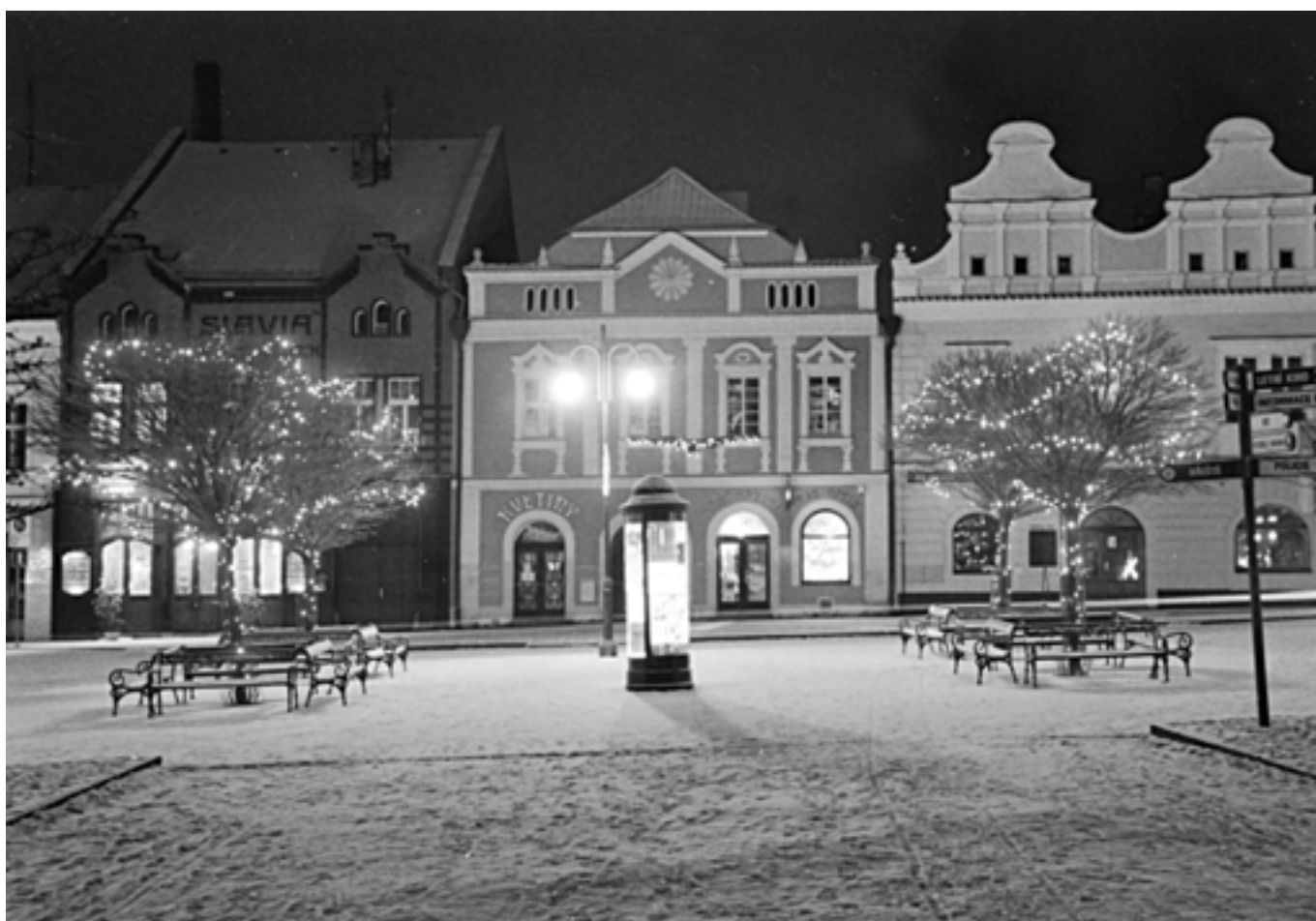
Západní část náměstí - 2009