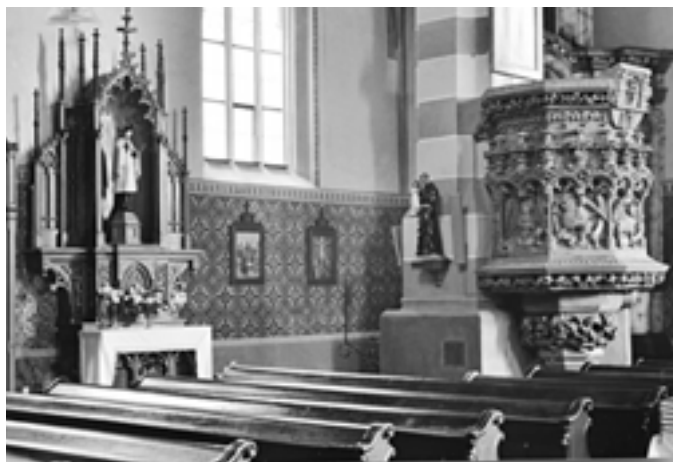
Kostel sv. Bartoloměje, kazatelna - 2009