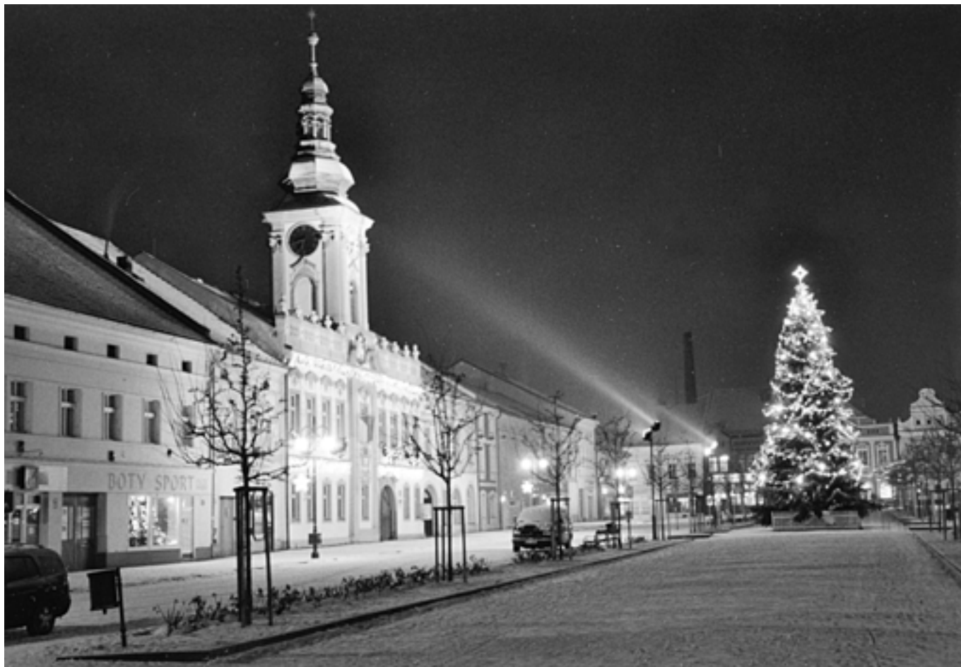
Vánoce 2009