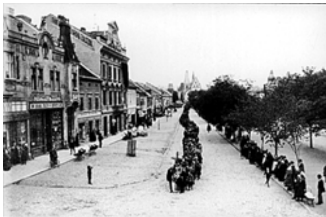
Husovo náměstí od západu - 20. léta