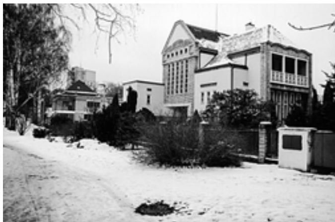
Lexova vila v parku při pohledu od MOA - 2006