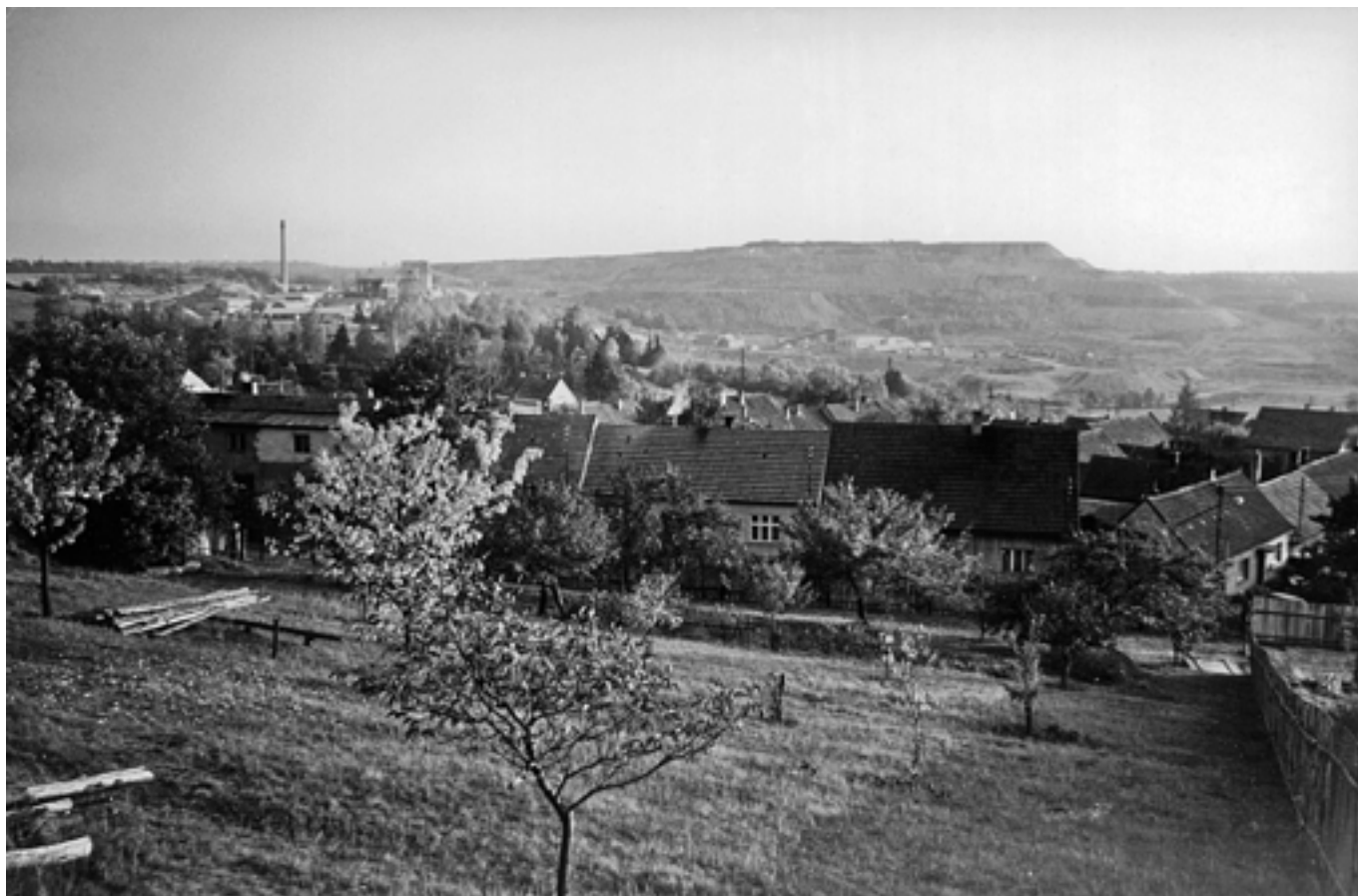
Kde na našem okrese stojí tato umělá „Stolová hora“? - 1982