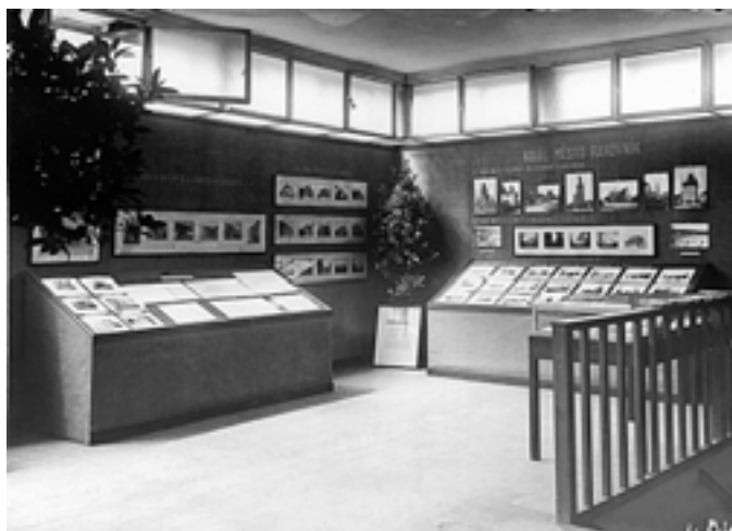
O kterou výstavní síň v našem městě se jedná? - 30. léta