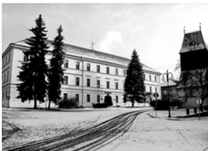
Gymnázium Zikmunda Wintra - 2006