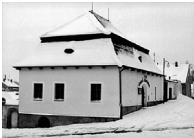
Česká chalupa na rohu ulic Kamenná a U Hluboké studny - 2006