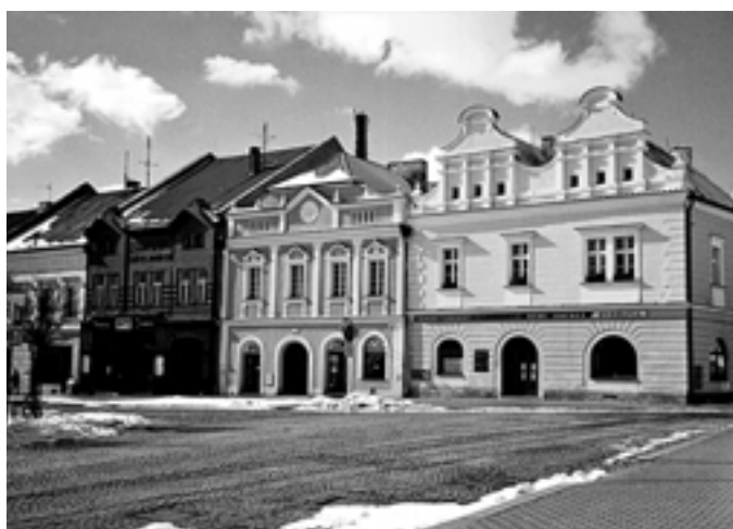
Západní čelo Husova náměstí - 2005