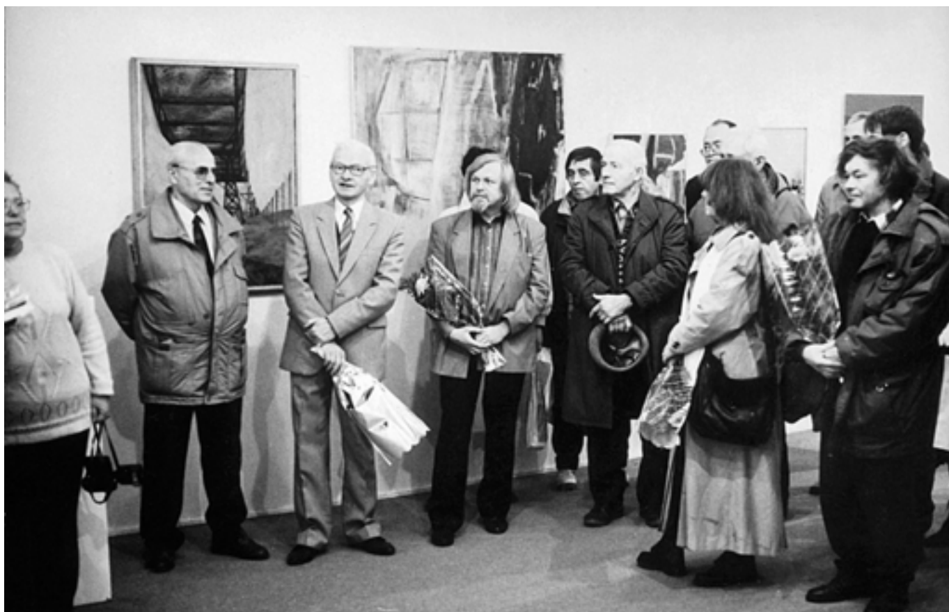
Poznáte někoho na snímku? - 1996