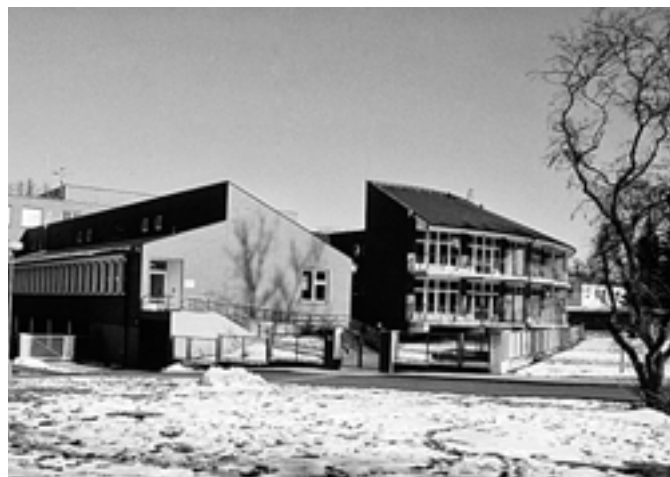
Základní a mateřská škola speciální v parku, ulice F. Diepolta - 2006