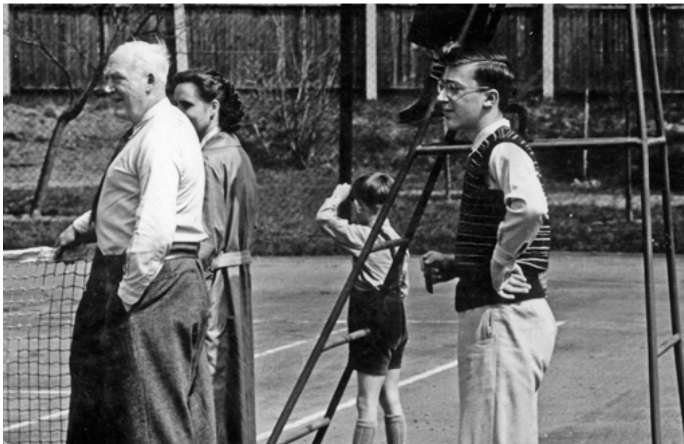
Poznáte někoho na snímku z 50tých let?