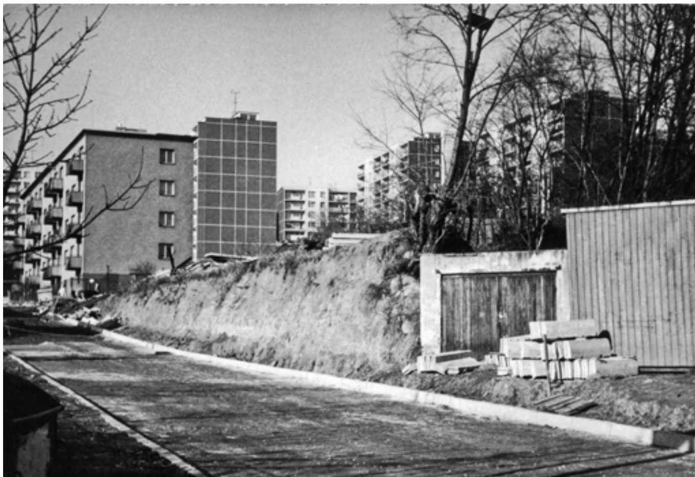
Ulice „V Jamce“, zde dnes stojí obchodní dům Norma. - 1989