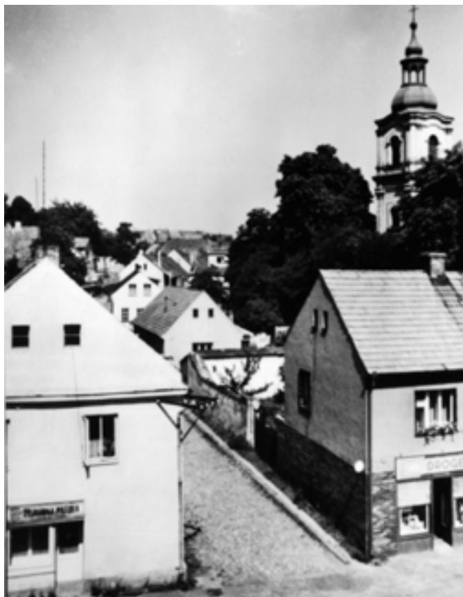
Jak se jmenuje tato obec na jihozápadě našeho okresu? Je pojmenovaná po pramenité vodě.– 70. léta