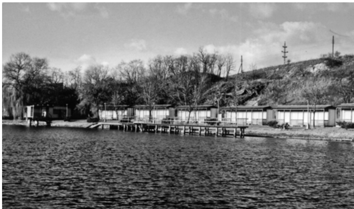
Tyršovo koupaliště. - 1982