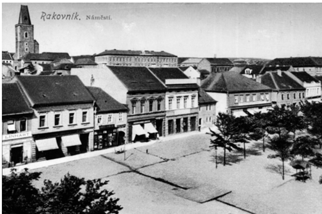
Husovo náměstí. - 1916