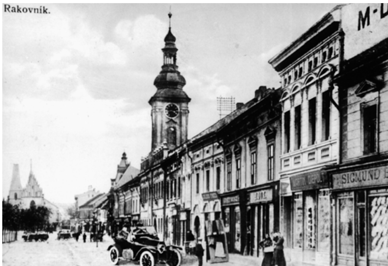
Husovo nám. - jižní strana - 1915