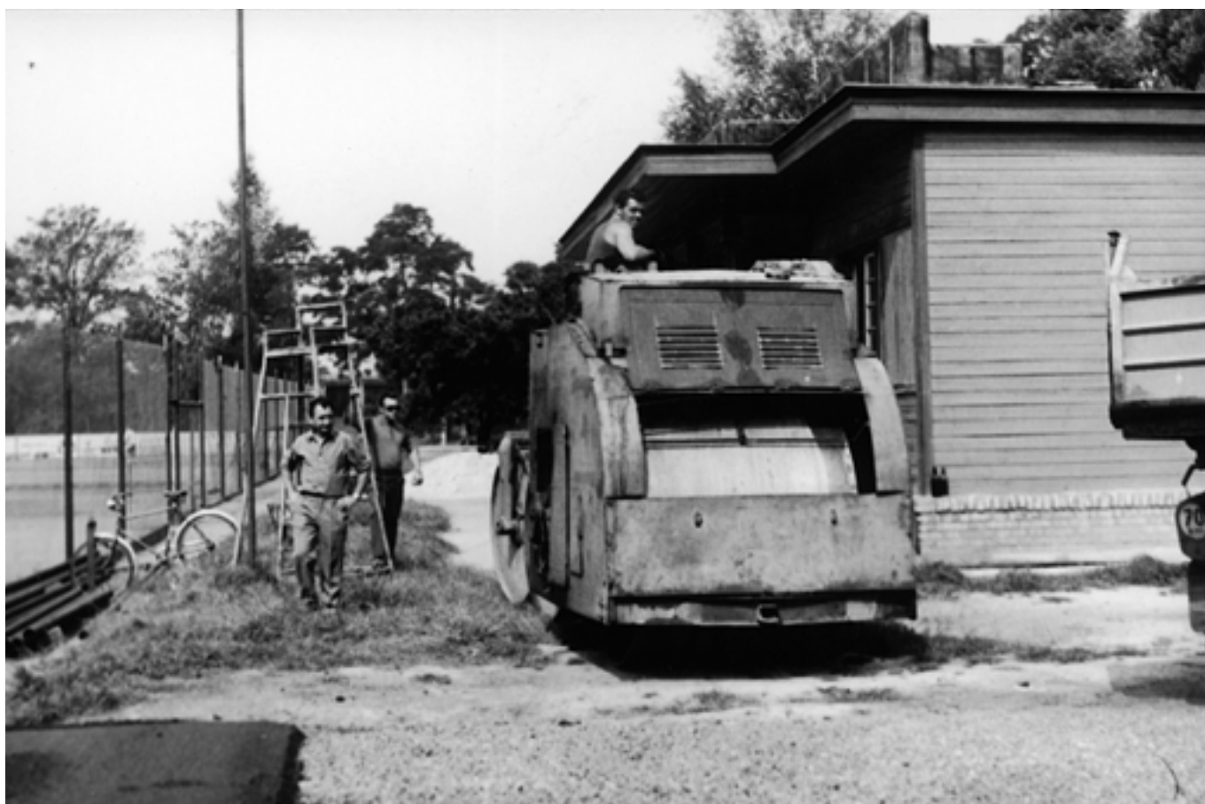
Kde v našem městě v 80. letech probíhala tato pracovní činnost?.