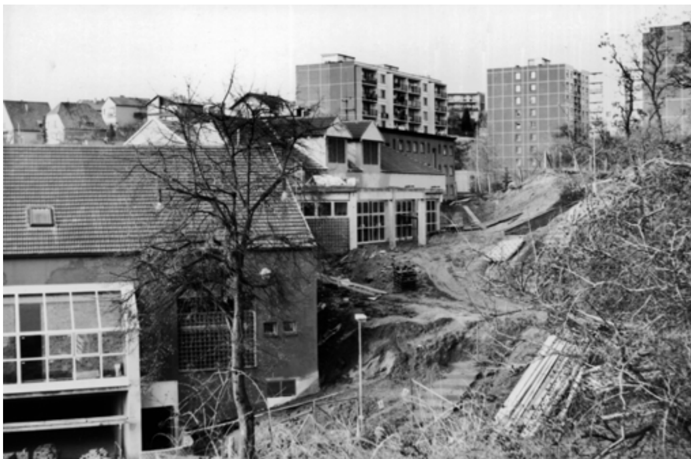
Výstavba obchodního domu V Jamce - 1992