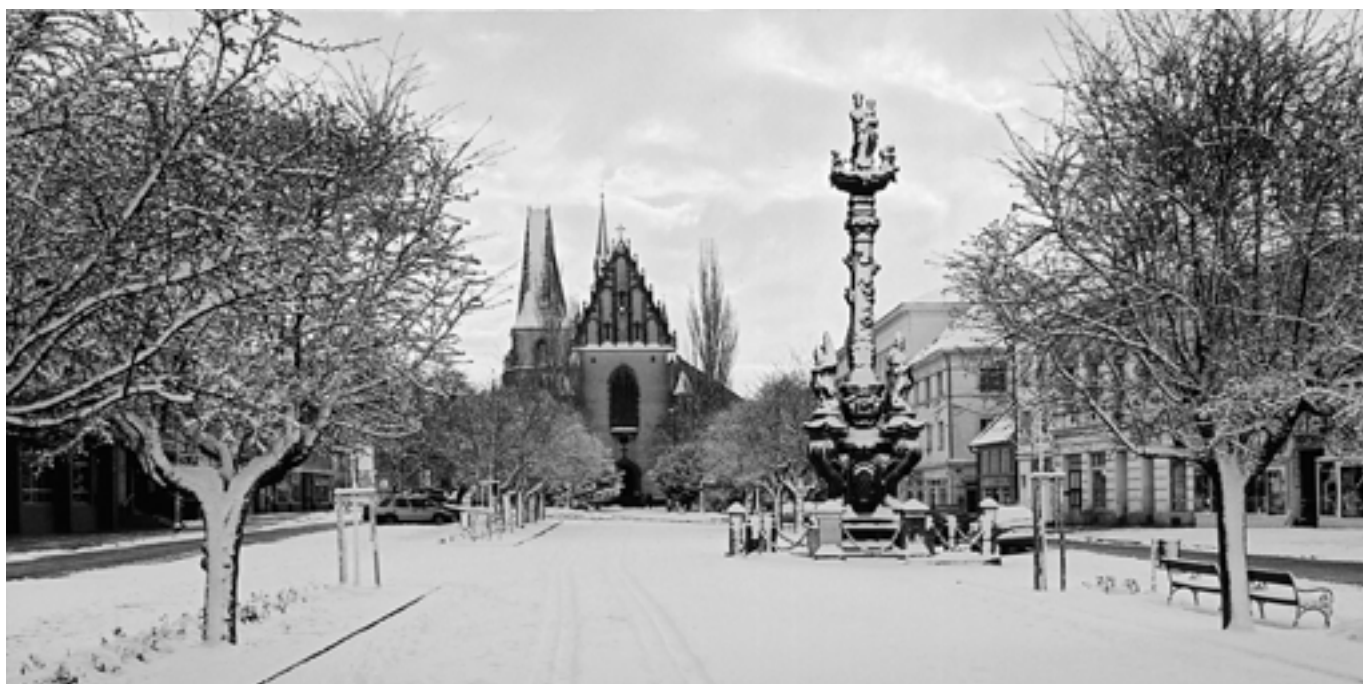
Husovo náměstí od západu