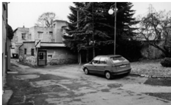
Kde v našem městě je toto zákoutí?

Zato snímek, na kterém jsme hádali, o jakou ulici v našem městě jde, dopadl dost bledě. Ono je to na tom „Tržáku“ dosti zamíchané, a tak se není co divit. Ze 103 odpovědí jich bylo 32 trefou vedle cíle. Všichni, co do uzávěrky poslali odpověď, uhodli, že jde o Tržák a jeho tři ulice nad sebou. Bezejmennou, Jilskou a Flemíkovou, které spojují ulice Na Francouzích a Libertinovu. Jen z jedné ulice je ale vidět komín pivovaru, tak jak je na našem snímku. Tyto tři ulice už dnes vypadají trochu jinak, ale tento komín naprosto jasně mluví pro ulici Jilskou. I když dva luštitelé jednoznačně tvrdí, že takto dobře je komín nemocnice vidět jen z bezejmenné ulice. Je to sice pravda, ale otočená o sto osmdesát stupňů, neboť odjaktěživa sluníčko svítí od jihu a ne od severu. Aby těch problémů nebylo málo, tak při nynějším losování vyhrál čtenář, který se za svou SMS nepodepsal, a na svém čísle není k dosažení. Uvádím jeho poslední šest čísel, ale na MIC budou mít k dispozici číslo celé. Výhercem se stává číslo xxx 367 784, které bylo pod SMS zasláno 10. 12. 2008 v 9:11 hodin. Vítězi blahopřeji a žádám jej, aby si v lednu 2009 na Městském informačním centru vyzvedl svoji knižní odměnu.