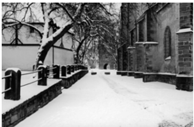
Jedno z nejhezčích zákoutí našeho města