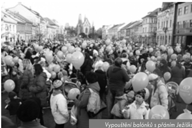
Vypouštění balonků s přáním Ježíškovi