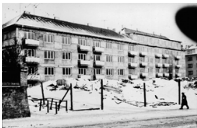
Výstavba v Malcově ulici (asi 60. léta)