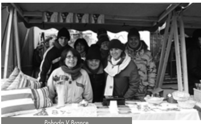
Pohoda V Brance