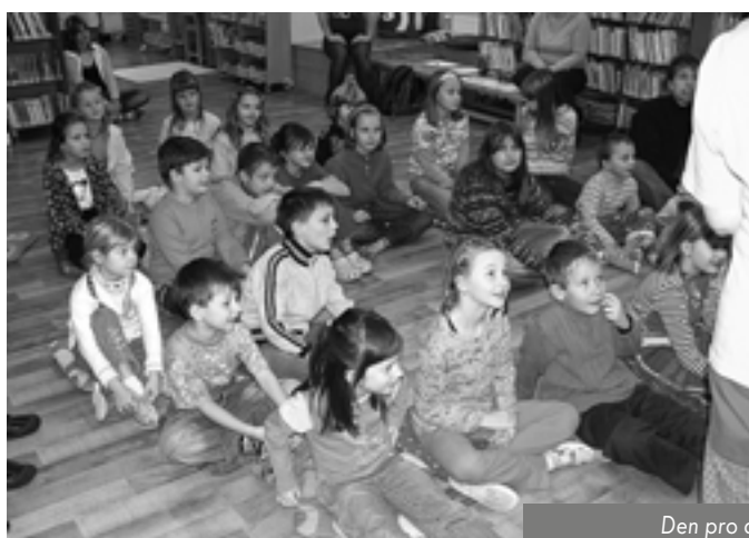
Den pro dětskou knihu