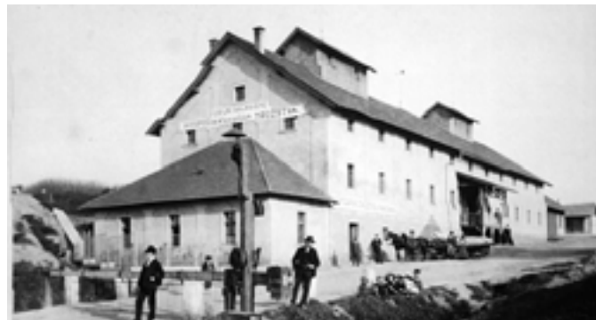
Ottova ulice proti Rakoně P+G. (Foto neznámý autor 20. léta)