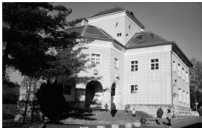
Ve které obci stojí tato výstavná budova a co to je?