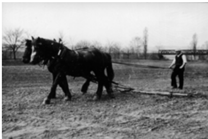
Dvacátá léta na polích u Lounského mostu – pod kasárnami