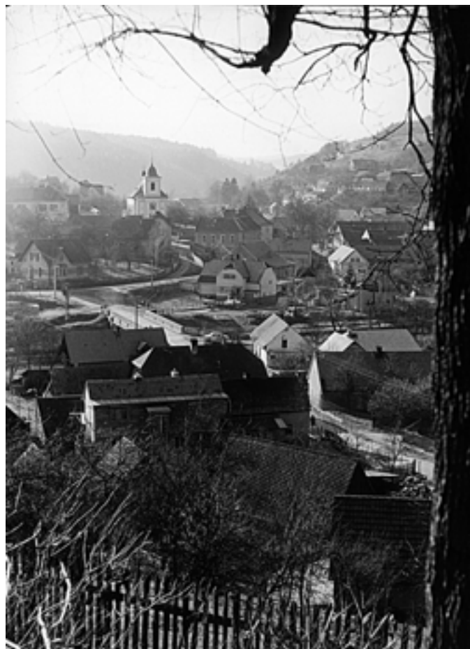
Která obec ležící na Rakovnickém potoce je zachycena na tomto snímku? 80. léta