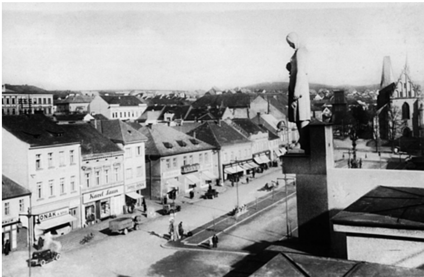
Husovo náměstí - 30. léta