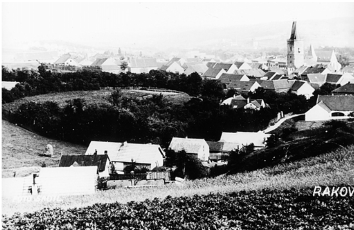
Pohled z Bendovky na Vysokou bránu - 50. léta