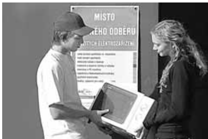
Místa, kam je možné odložit vysloužilý elektrospotřebič jsou označena informační tabulí s uvedením všeho elektrozařízení, které je možné na tato místa odevzdat.

Ceny spotřebičů se tím ale za dobu fungování této úpravy nezměnily. Jediný rozdíl spočívá v tom, že z ceny výrobku byly viditelně vyčleněny