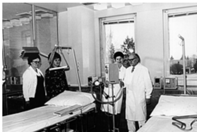
Interiér nemocnice v našem městě. Poznáte nějakou osobu na snímku? 80. léta