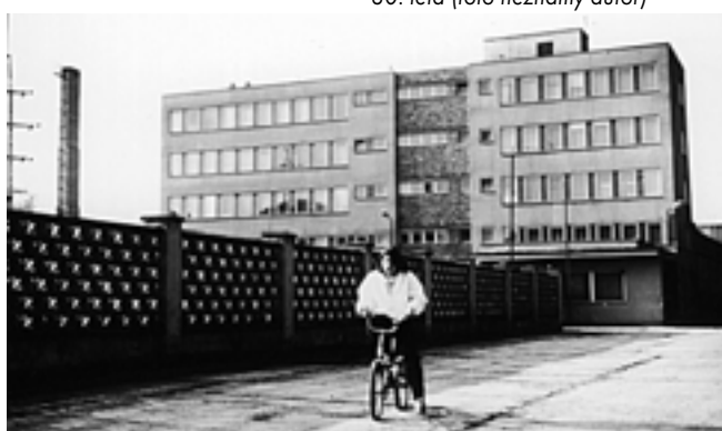
Budova bývalého OPP u Tyršova Koupaliště, ul. Za Plynárnou 1999