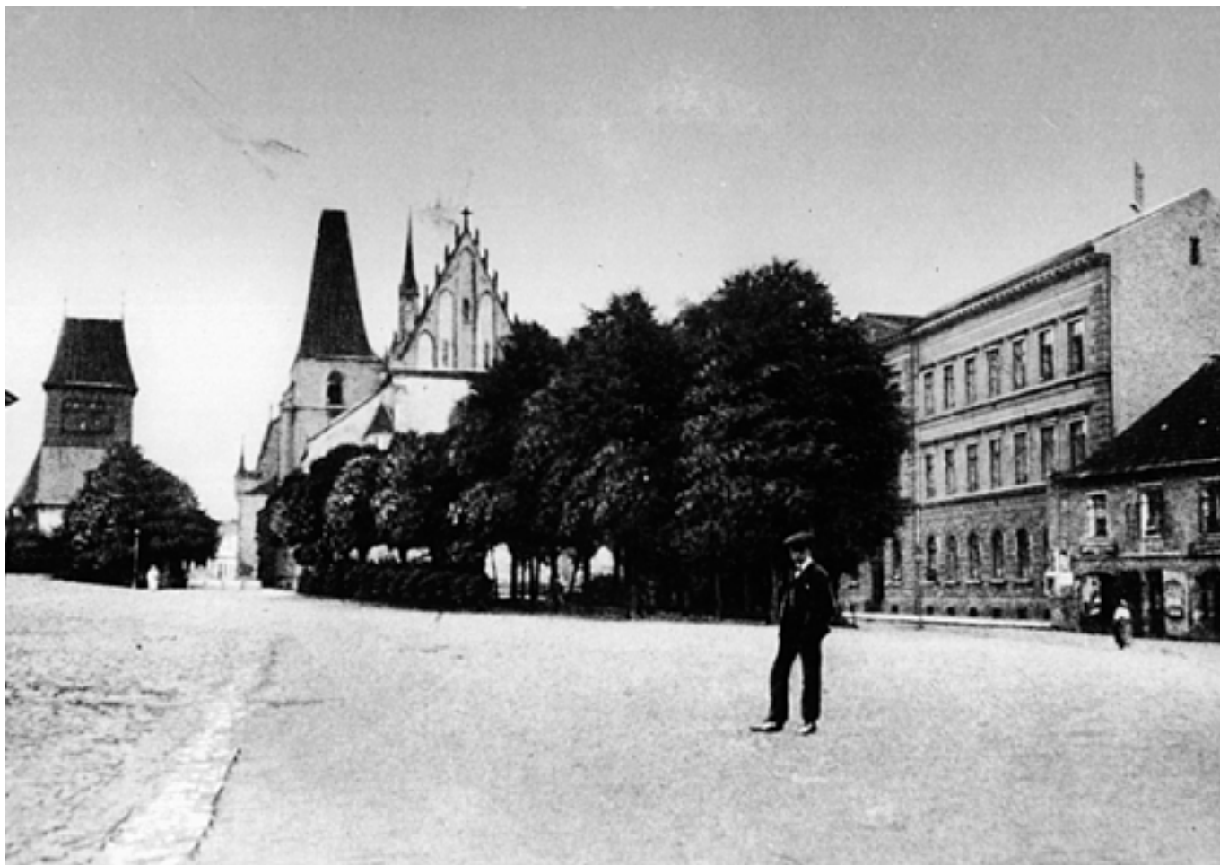
Husovo náměstí - 10. léta