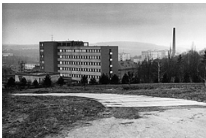
Nový pavilon okresní nemocnice - 1985