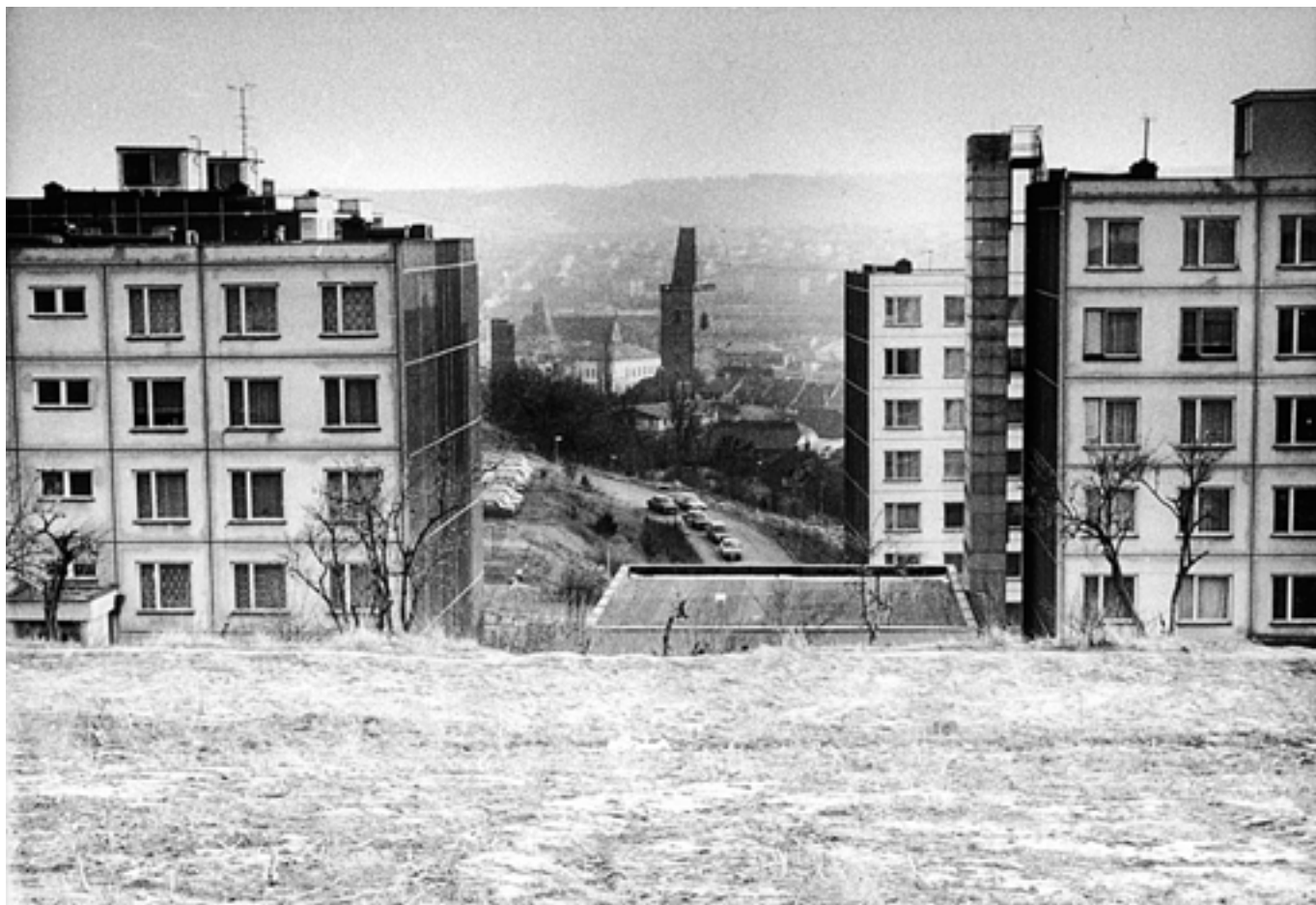
Pohled z Bendovky na Vysokou bránu - 1994