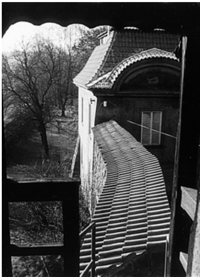
Která budova našeho městaje zachycena na tomto snímku? 1991