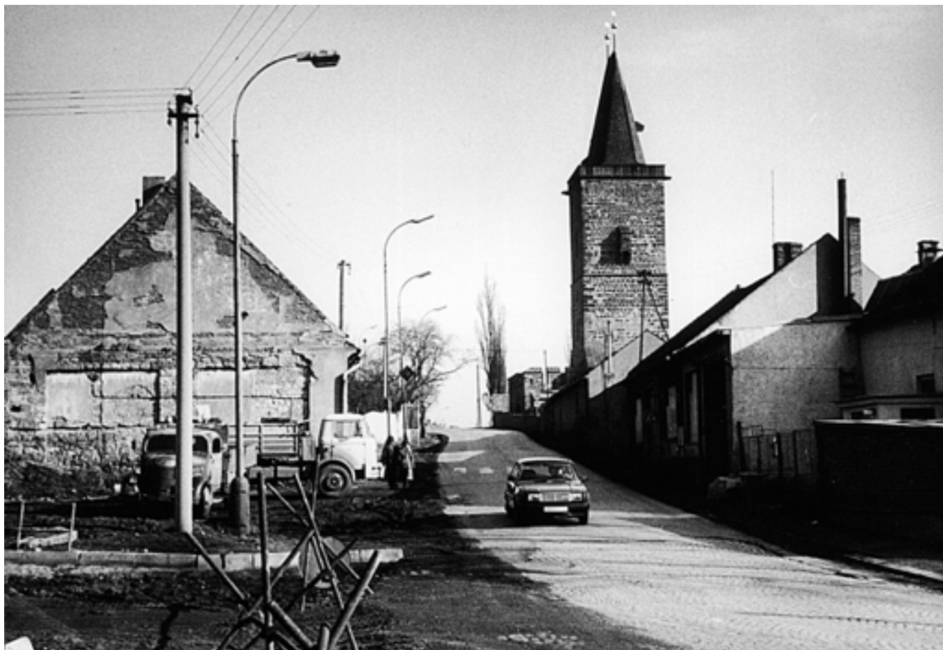
Ulice Rudé Armády - Lišanská - 1989