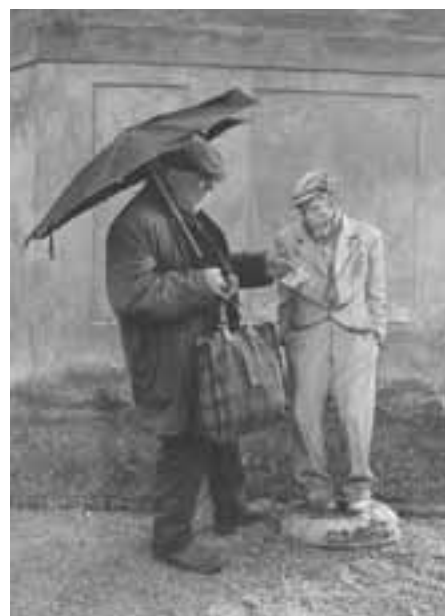
2. Kde byla vyfocena tato fotka? - 70. léta