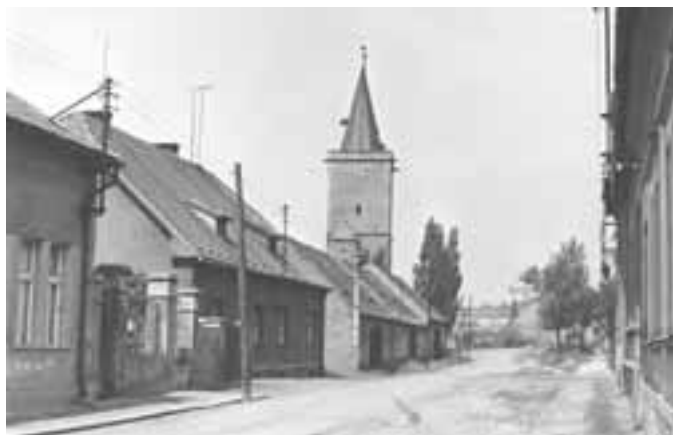
Vladislavova ulice – 1965