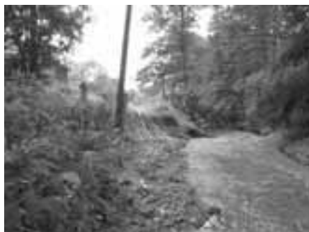
Nádrž na Rakovnickém potoce před opravou.