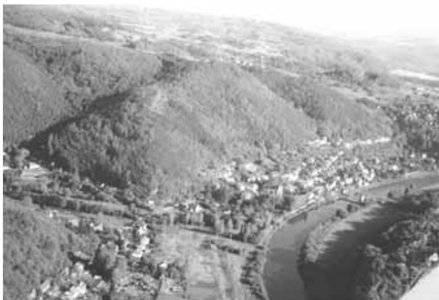
3. Která obec našeho okresu je zde vyfocena? - 2002