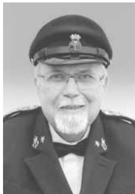
4. Kdo je tento muž z našeho okresu a jaké má odznaky na své uniformě? - asi 2008