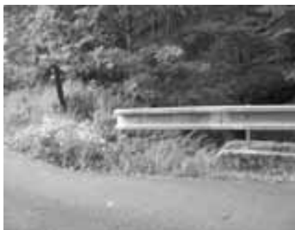
Opravený levý břeh Rakovnického potoka.