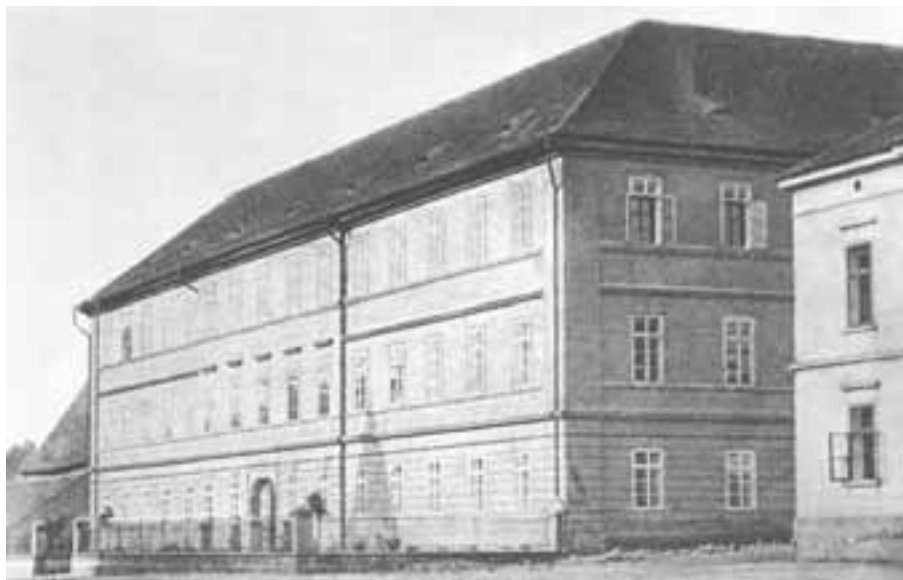
Rakovnická reálka - 1880