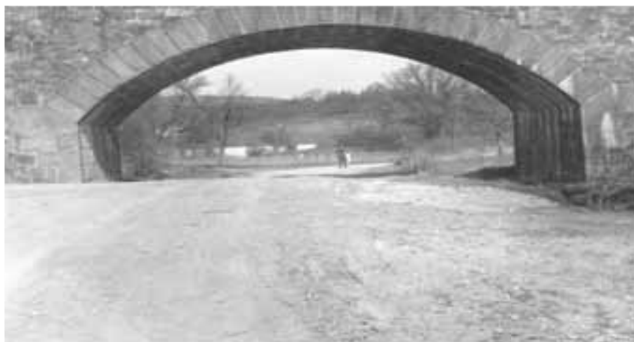
1. Kde stojí tento viadukt a kam se díváme? - 70. léta