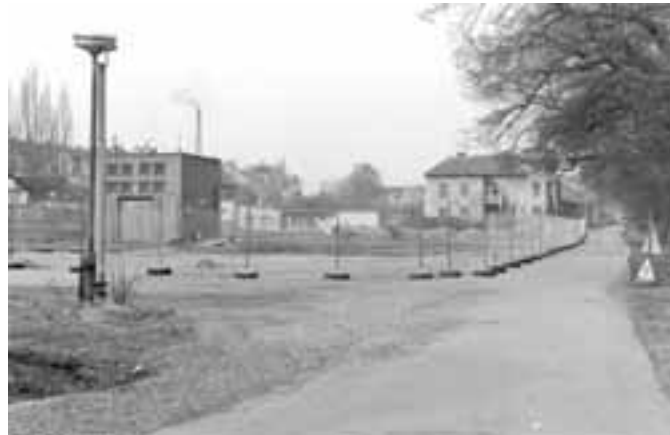
Bývalý Koňský rybník na nábřeží T. G. M. – 1988