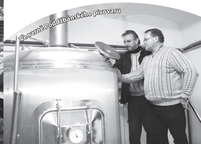
Ve varně Poddžbánského pivovaru