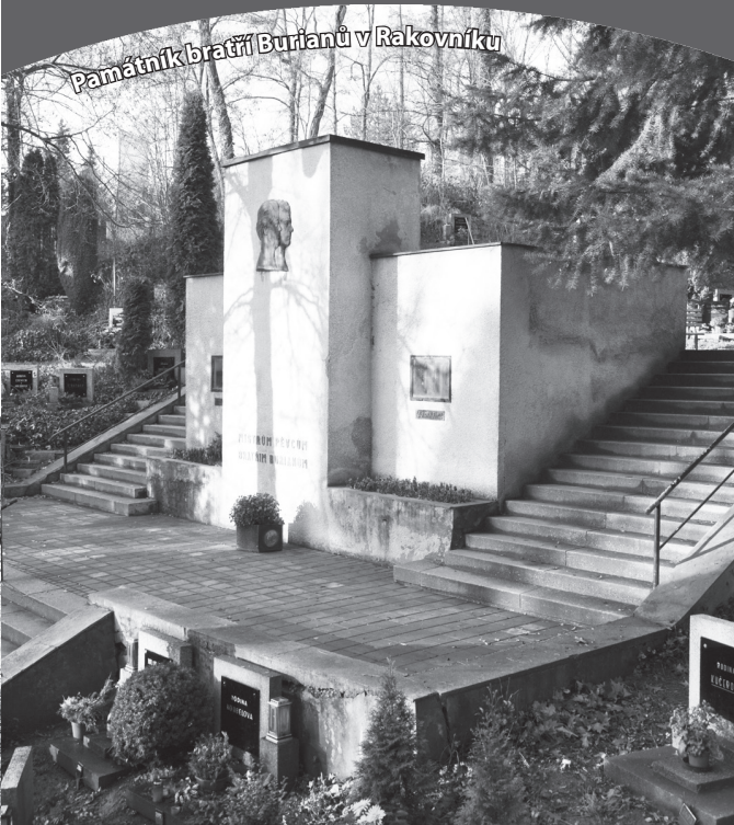
Památník bratří Burianů v Rakovníku

Světově známý operní pěvec Karel Burian (1870-1924) sice poznal na svých uměleckých cestách celý svět, jeho rodné Rakovnícko však pro něj zůstalo pevnou součástí jeho života. Vydejte se po Burianových rakovnických stopách – z jeho rodného Rousínova (rodný domek s pamětní deskou), přes Senomaty (pamětní kámen na místě jeho statku, kde v roce 1924 zemřel) do Rakovníka k Památníku bratří Burianů v urnovém hájku, kde jsou uloženy urny s popelem Karla Buriana a jeho bratra Emila, vynikajícího barytonisty.