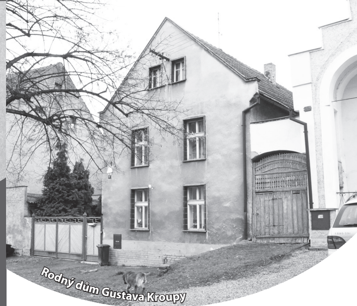
Rodný dům Gustava Kroupy