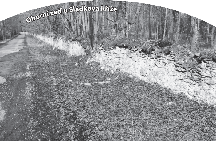
Oborní zeď u Sládkova kříže

Před dvěma stoletími nechal křivoklátský kníže Karel Egon I. Fürstenberg vystavět napříč křivoklátskými lesy kamennou zeď, která měla zabránit přebíhání zvěře na sousední panství. Zeď měřila více než dvacet kilometrů a táhla se od Lužné až k Lánům. Z unikátního díla se dochovaly jen části, ty nejzachovělejší najdete u hájovny Sládkův kříž při silnici z Lužné do Krušovic a na severozápadním úbočí vrchu Louštína.