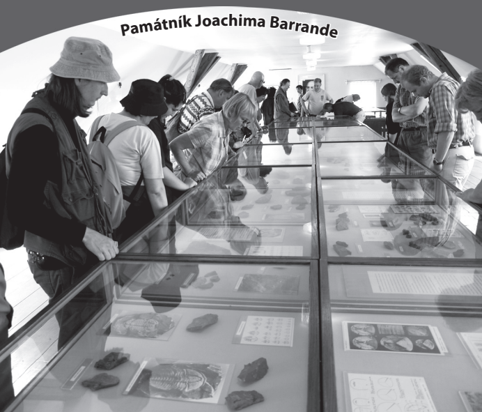
Památník Joachima Barrande

Co navštívit: Památník Joachima Barrande (otevřeno: květen, červen, září – víkendy, červenec, srpen – útn, www.muzeumtgm.cz ) s expozicí zkamenělin skryjsko-týřovického kambria, pomník J. Barrande v zahrádce před bývalou školou, naleziště V Luhu (na pravém břehu Berounky nad skryjským mostem), kde je v suti dovoleno pátrat po zkamenělinách.