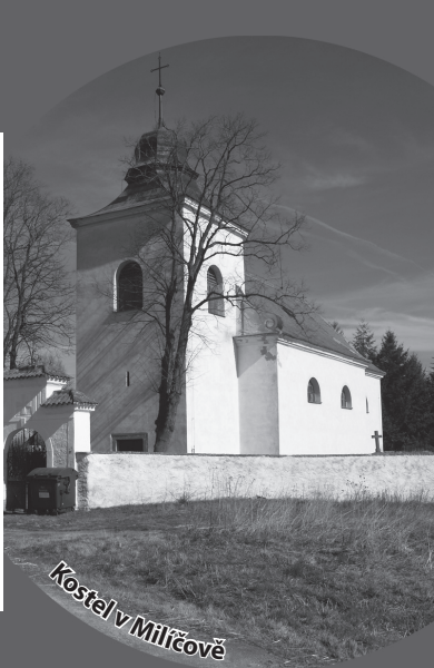
Kostel v Milíčově