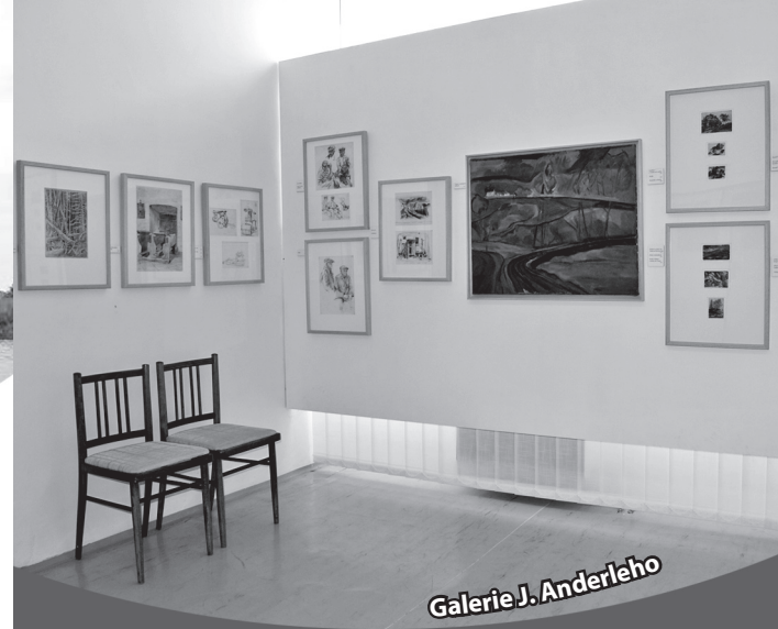
Galerie J. Anderleho

Popis trasy: Z Krakovce po červené turistické trase do Milíčova, odtud po cyklotrase číslo 0043 do Krakovce. Celkem 7 km. Podrobnosti na www.rakovnicko.info . Informace o hradu Krakovci na www.hrad-krakovec.cz .