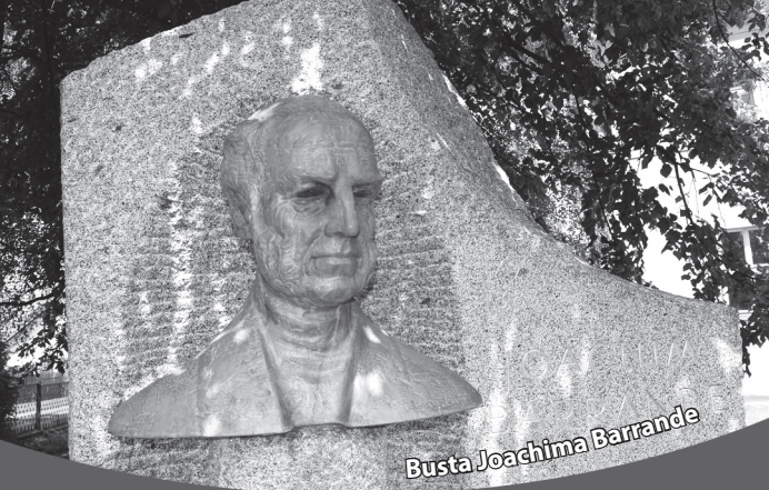
Busta Joachima Barrande