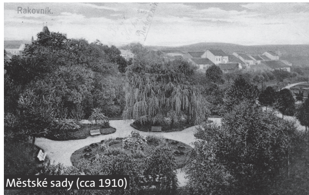
Městské sady (cca 1910)