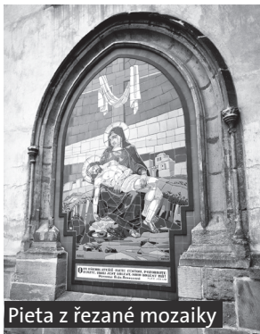
Pieta z řezané mozaiky

3 Čermákovy sady, které se rozprostírají pod kostelem sv. Bartoloměje a u sokolovny nesou jméno Josefa Čermáka (1853-1917), pokrokového starosty města Rakovníka v letech 1893-1910. Narodil se v Praze. Do Rakovníka přišla Čermáková rodina v roce 1878 podnikat v cukrovárnictví. Josef Čermák usiloval o povznesení Rakovníka na moderní a úpravné město. Zasloužil se zejména o založení tří městských sadů (pod kostelem, u sokolovny, v ulici Na Sekyře), o postavení chlapecké školy (nynější 1. ZŠ v Martiňovské ulici), o postavení nového sídla Spořitelny rakovnické (nynější budova pošty na Husově náměstí), o opravu Pražské a Vysoké brány, o plynové osvětlení města a v neposlední řadě i o vybudování tří železničních tratí – do Bečova, Mladotic a Loun. Městský park pod kostelem a u sokolovny nese Čermákovu jméno od roku 1917.