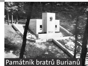
Památník bratrů Burianů

V horní části levé strany náměstí nemůžete přehlédnout tmavě šedou fasádu budovy Spořitelny rakovnické (8) (nyní KB) z roku 1934 od architekta F. A. Libry . Vlevo s budovou sousedí původní sídlo rakovnické spořitelny (nyní pošta) z roku 1897 od místního architekta Karla Dondy .