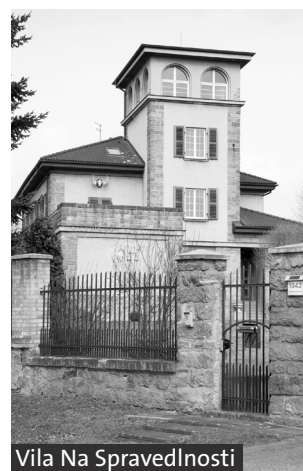
Vila Na Spravedlnosti

Pražskou bránou vejдемe do historického centra města. Hned za bránou po levé straně se nachází malý barokní palác (7) , postavený ve druhé polovině 18. století pláským cisterciáckým klášteřem a upravený ve 30. letech minulého století podle projektu pražského architekta Bohumila Hübschmanna (od 1945 používal počestněné příjmení Hypšman) pro účely městského muzea. Pražský rodák Bo-