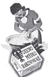
Výtečné ku praní vlněných, hedvábných i jemných látek.

Pod galerií se Vysoká ulice rozchází vlevo k Husovu náměstí a vpravo vzhůru do Havlíčkovy ulice. Dejte se vpravo kolem hostince U Zeleného stromu a na křižovatce vlevo Havlíčkovou ulicí kolem pivovaru až na světelnou křižovatku. Vpravo nad ní se před vámi otevře pohled Kokrdovskou ulicí k rakovnickému hřbitovu a urnovému háji. Vstupte klenutou branou na hřbitov (otevírací doba: květen-srpen - denně 6-20, září-duben - denně 8-18), při zdi několik kroků nad dřevěnou zvonici najdete hrob rodiny Ottovy s bustou Františka Ottu, významného českého podnikatele, výrobce známého mýdla s rakem.