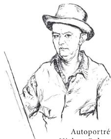
Autoportrét Václava Rabase

Pro Rabase bylo důležité, aby lidé jeho obrazům rozuměli, jen tak mohl naplnit ono poslání umělce – ukázat krásu, kterou lidé sami nevidí, necítí.