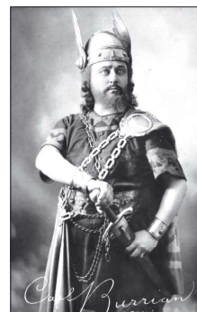
Karel Burian jako Tristan

(12. 1. 1870 Rousínov u Rakovníka - 25. 9. 1924 Senomaty)