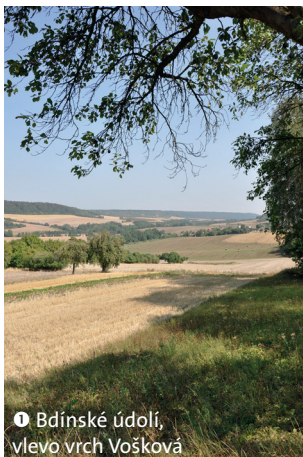
1 Bdinské údolí, vlevo vrch Vošková

11 KM TRASA OKOLÍM KALIVOD PRO NORDIC-WALKERY A PĚŠÍ TURISTY