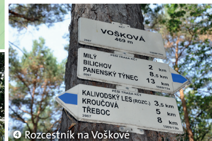
4 Rozcestník na Voškově