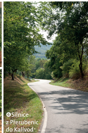
3 Silnice z Přerubnic do Kalivod