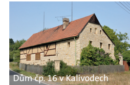
Dům čp. 16 v Kalivodech