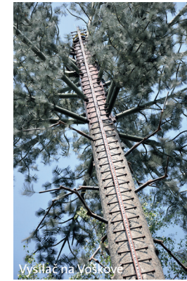
Vysílač na Voškově