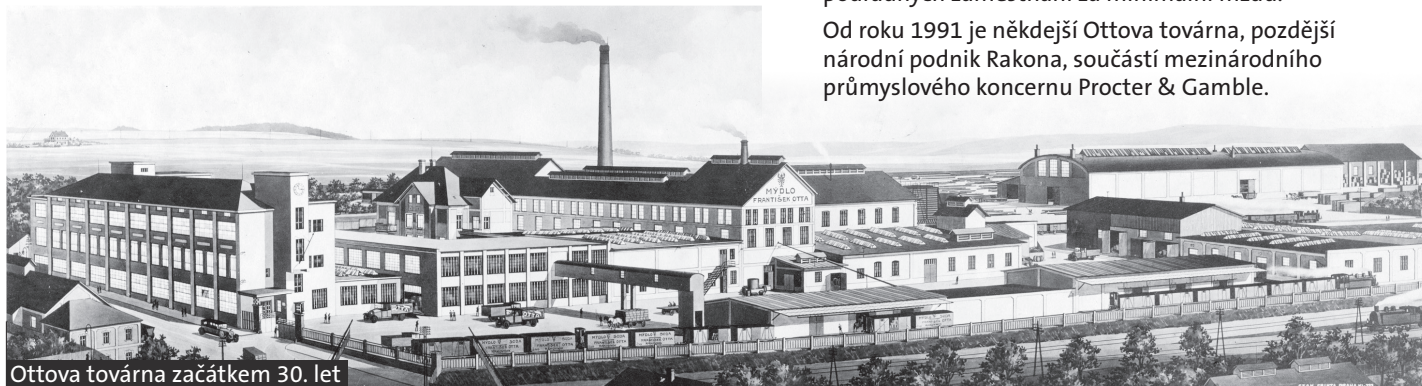
Ottova továrna začátkem 30. let

Od roku 1991 je někdejší Ottova továrna, pozdější národní podnik Rakona, součástí mezinárodního průmyslového koncernu Procter & Gamble.