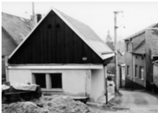
Pohled z Vysoké ul. do ul. V Brance směrem k náměstí. (1979)