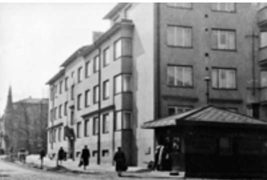
Křižovatka Nádražní a Tyršovy ulice. (1956)