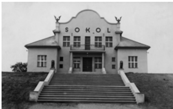
Kde v našem okrese se nachází tato nádherná sokolovna, která je známá svou historickou oponou na jevišti od malíře Brázdy? (40. léta)