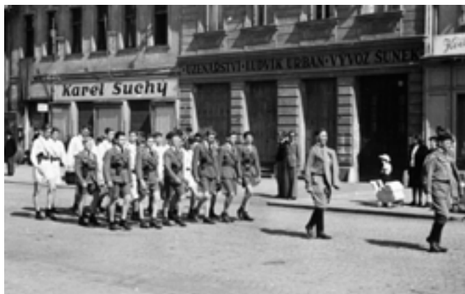
Pochod Sokolů po Husově náměstí. (40. léta)