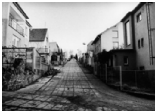
Ulice Nad Jamkou. (1988)