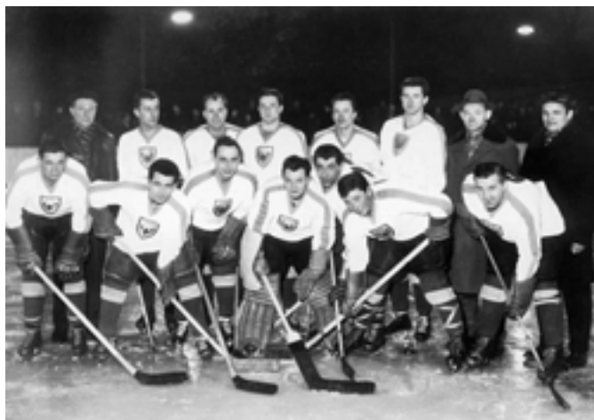
Naši hokejisté v roce 1964. Poznáte někoho?