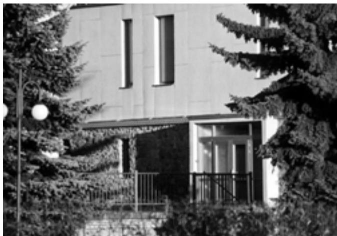
Kde v našem městě se nachází toto zákoutí? (2004)