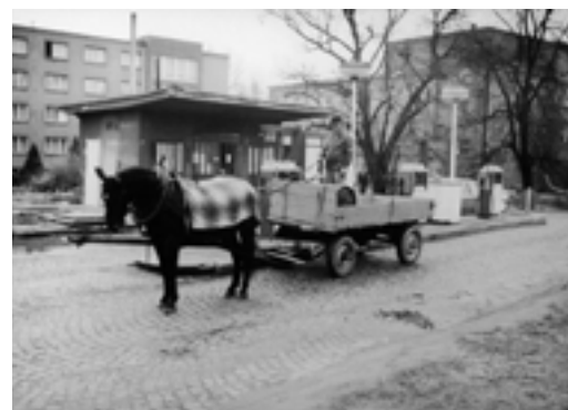
Wintrovo nám. u obchodní školy (MOA), stará benzinová pumpa. (1986)