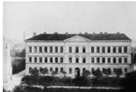
Dívčí škola (2. ZŠ). (20. léta)