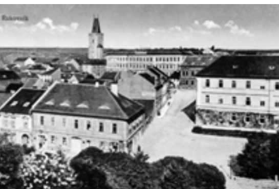
Žižkovo náměstí (dříve Chlumčanského náměstí). (30. léta)