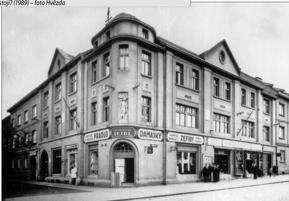
Kde stojí tato budova a co v ní dnes je? (20 – 30. léta)