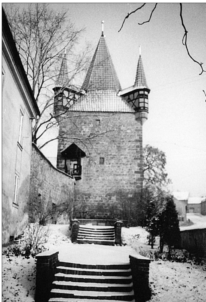
Pražská brána (1983)