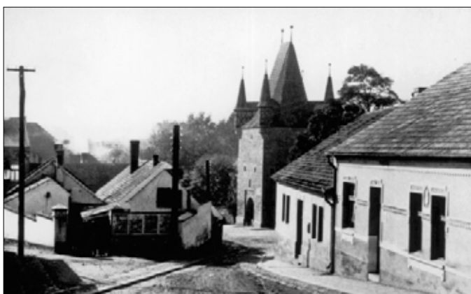
Smetanova ulice (Pod Hrádkem) – (asi 30. léta)