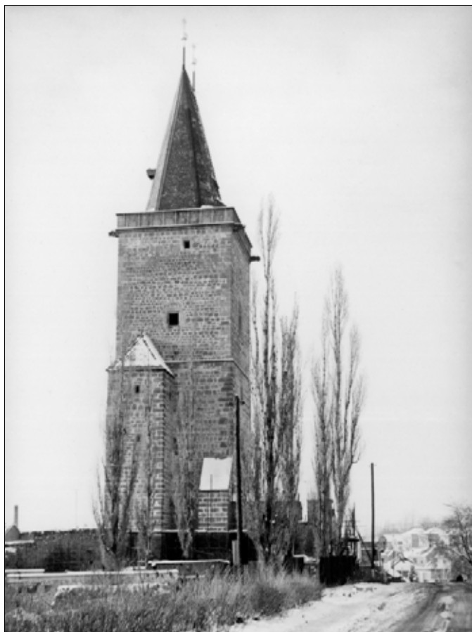
Vysoká brána (1985)