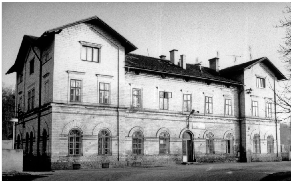
Co je to za budovu a kde na našem okrese stojí? (1989)

S pozdravem Dobré světlo Václav Hvězda, Amfora