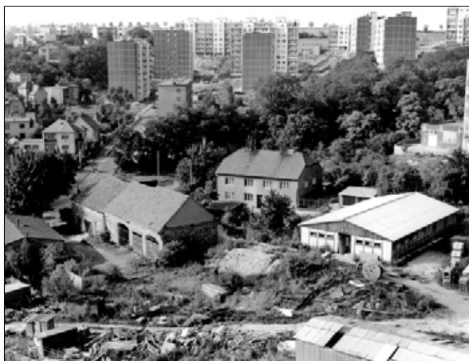
Pohled z Vysoké brány na Bendovku (90. léta)