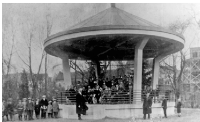
Čermákovy sady, hudební pavilon (údajně 1936)