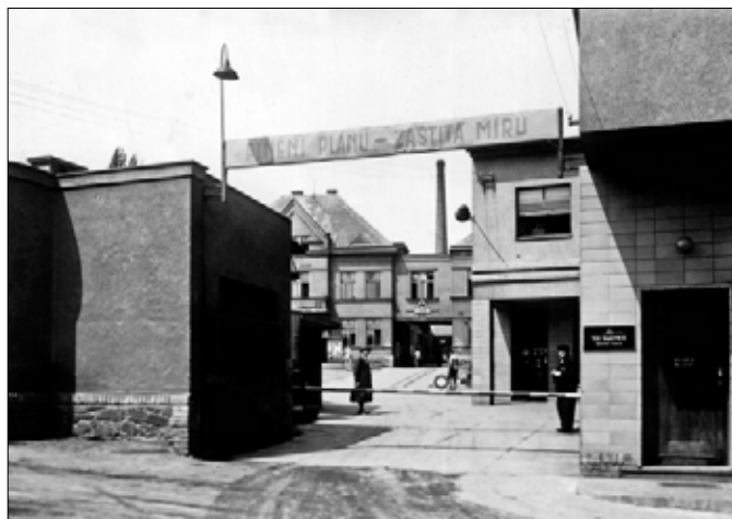
Vchod do podniku TOS (Vltavský) – (1960)