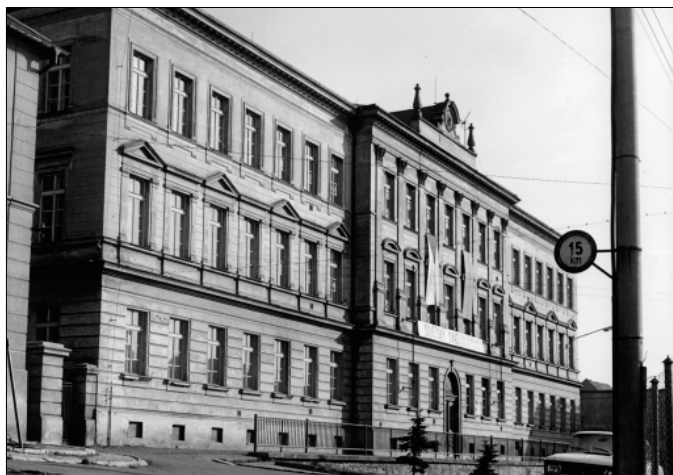
1. ZDŠ (ZŠ) chlapecká škola (1997)