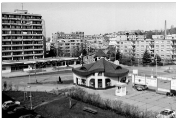
Křižovatka „Na Váze“ (okolo roku 2000)