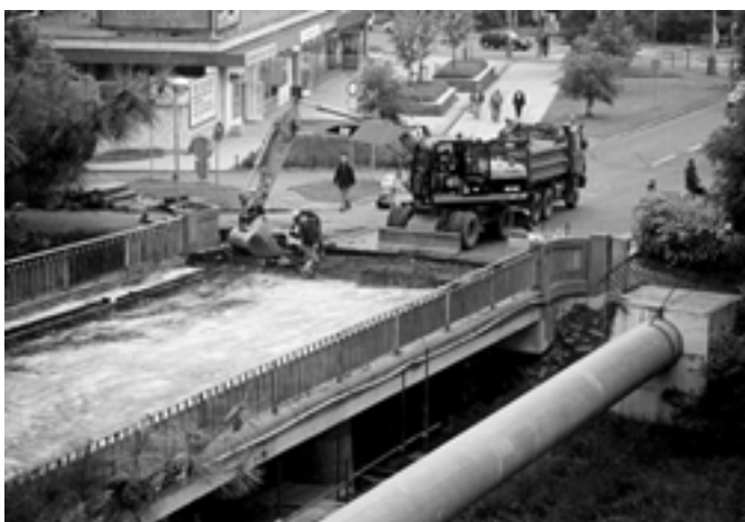
Oprava mostu v Ottově ulici. Foto M. Hekl (2004)

S pozdravem Dobré světlo Václav Hvězda, Amfora