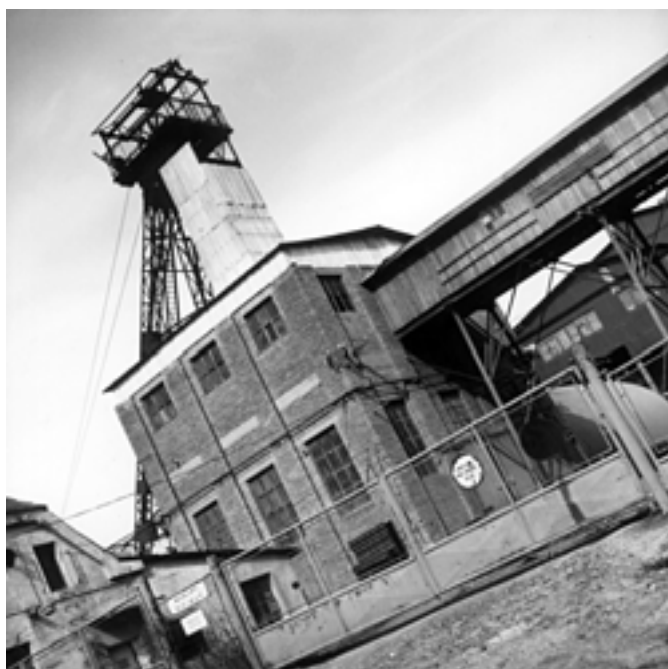
Důl Rako - Na Lapáku. Foto V. Hvězda (70. léta)