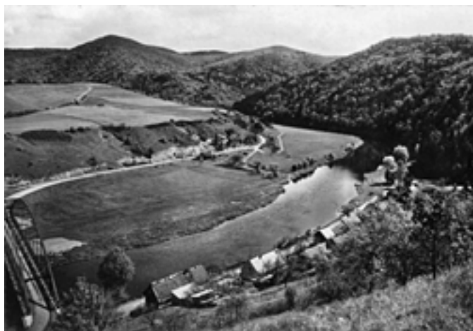
Kde se nachází vyfocená partie na "Staré řece" v našem okrese? (50. léta)