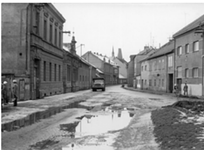
Pražská ulice. (60. léta)