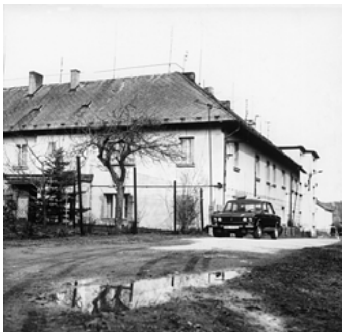
Obytné domy v Krčeláku u Lubné. (70. léta)