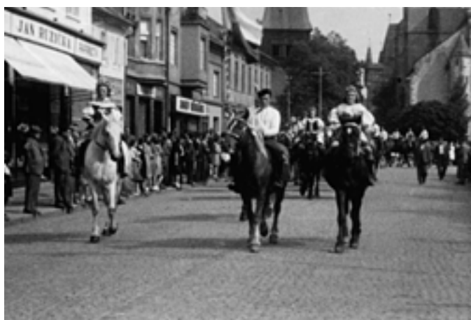
Selská jízda na Husově náměstí. (40. léta)