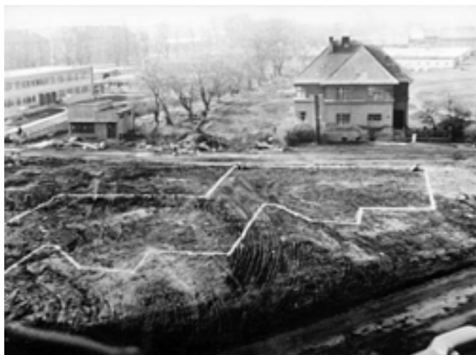
Prostor vybourané ulice "U 7 zlodějů" (Čs. legii) s přípravou na stavbu harmoniky. (60. léta)