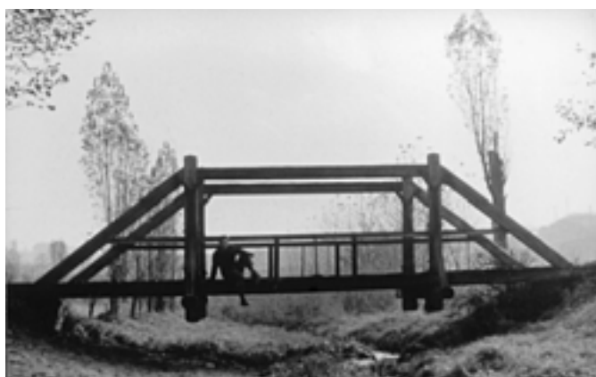
Kde v blízkém okolí Rakovníka stával tento most? (1964)