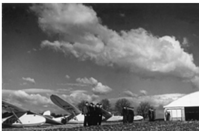
Pozdně podzimní ráno na rakovnickém letišti. Foto K. Koubek (1954)