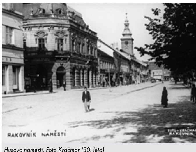
Husovo náměstí. (30. léta)