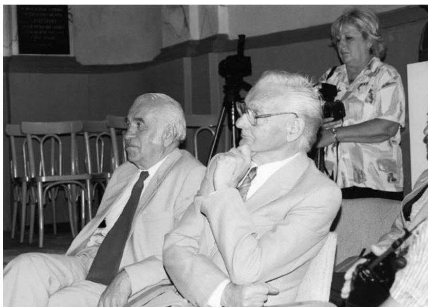
3. Poznáte někoho na tomto snímku? 90. léta