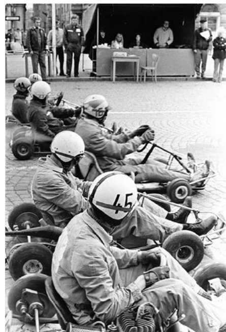
Start motokár na Husově náměstí. Foto Hvězda, 1974