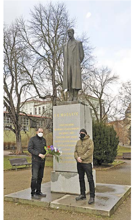
7. 3. 2021 jsme si připomněli 171. výročí narození T. G. Masaryka.