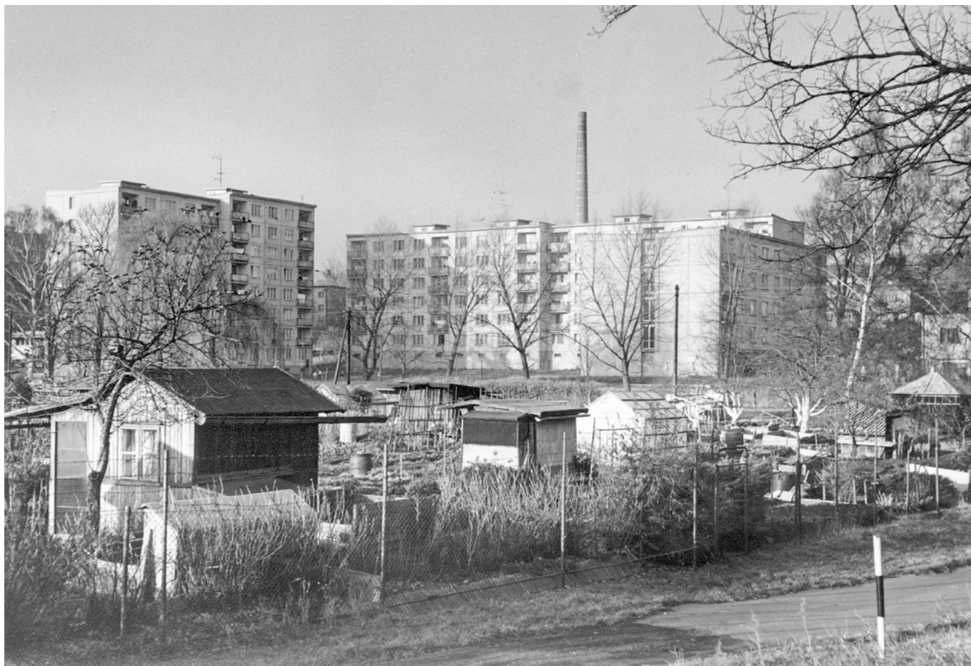
Bývalá zahrádkářská kolonie U Studánek na Černém potoce. 1989