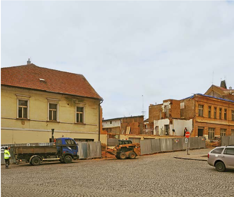
Výstavba víceúčelového studijního a společenského centra pokračuje.