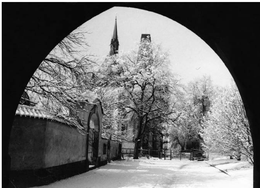
Kostel sv. Bartoloměje při průhledu Pražskou bránou. Foto Hvězda, 80. léta