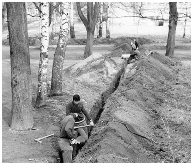
Výkopy pro kabely elektrického vedení v parku u MOA pro plavecký bazén. 1975