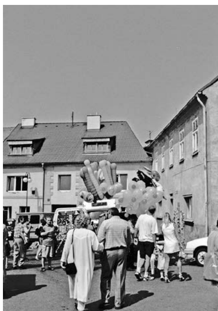
1. Kde to v Rakovníku jsme? Foto Štýbrová, 2003