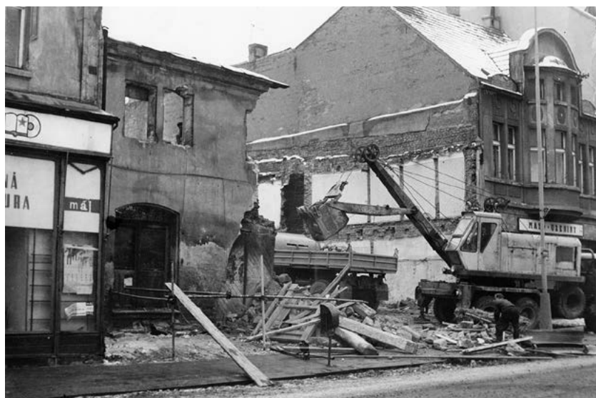
Bourání domů na jižní straně Husova náměstí. Foto Karel Koubek, 60. léta