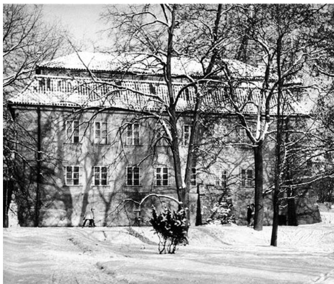
Muzeum T. G. M. při pohledu z parku. 90. léta