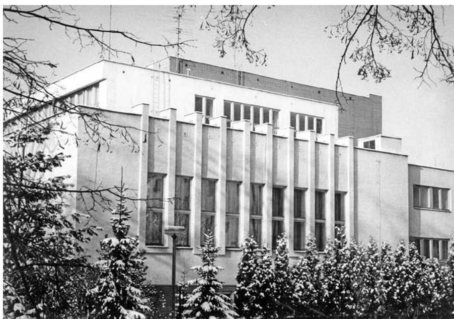
2. Kde ve městě stojí tato budova? 90. léta